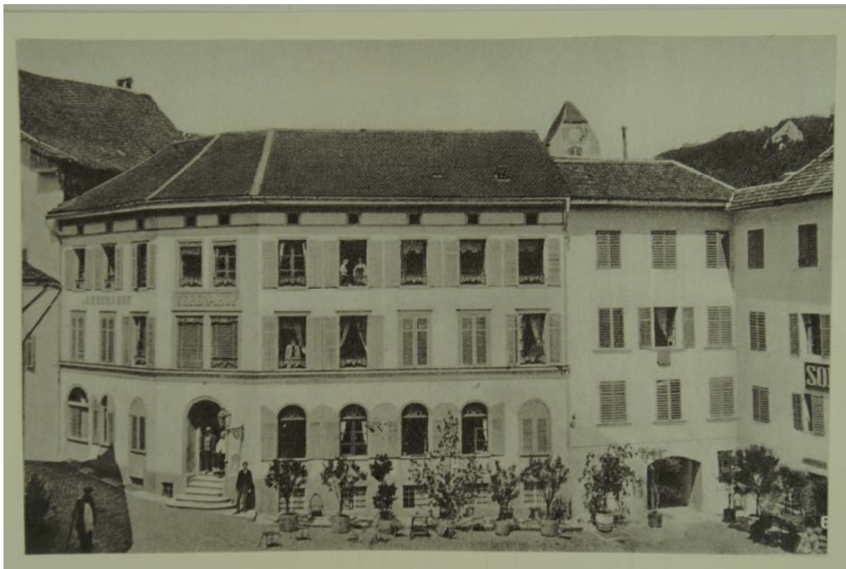
Kurz vor 1870. Der Südteil des Verenahofs steht bereits. Rechts daneben die "Sonne". Dahinter schaut der Turm der alten Dreikönigskirche hervor.

1829 erbohrte der Wirt des "Löwen" auf seinem Grund die "Verenahofquelle" und legte damit den Grundstein zum Bau des gleichnamigen Bäderhotels. 1845-47 wurde an Stelle des "Löwen" der südliche Teil des Verenahofs gebaut. 1870 wurde auch die benachbarte "Sonne" abgebrochen und der "Verenahof" um den Nordtrakt mit dem grossen Saal erweitert.