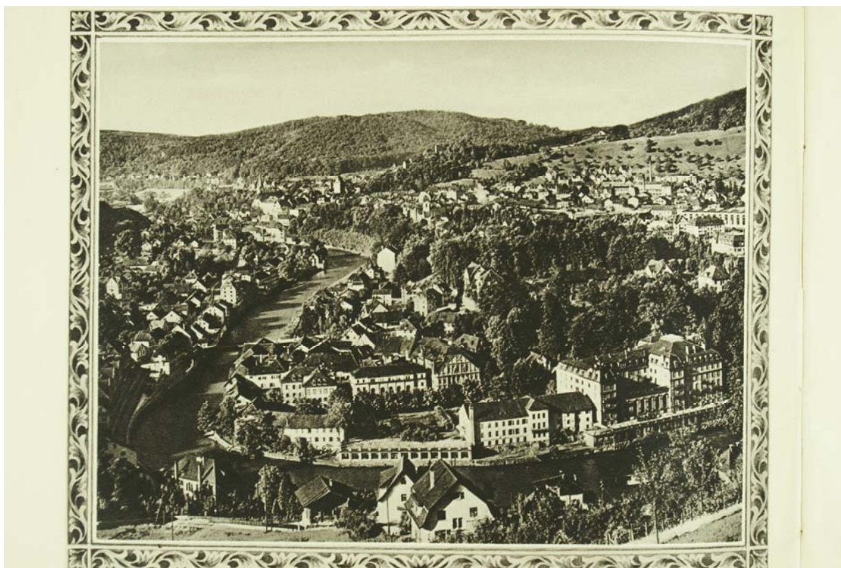
Der Kurort Baden um die Jahrhundertwende. Ganz rechts das "Grand Hotel".

1870 verkaufte Besitzer Dorer den maroden "Hinterhof" und liess dessen Bauten abreißen. An seiner Stelle errichtete man das „Grand Hotel“. Einen klassischen Neorenaissancebau des ausgehenden 19. Jh. Doch die Pracht des "Grand Hotels" währte nicht lange: Während dem Ersten Weltkrieg blieb die vermögende Kundschaft aus und die folgenden 20er-Jahre mit der Weltwirtschaftskrise trugen zum Niedergang des stolzen Hauses bei. 1944 wurde das "Grand Hotel" in einer Zivilschutzübung gesprengt. Heute befindet sich an seiner Stelle die Tiefgarage.