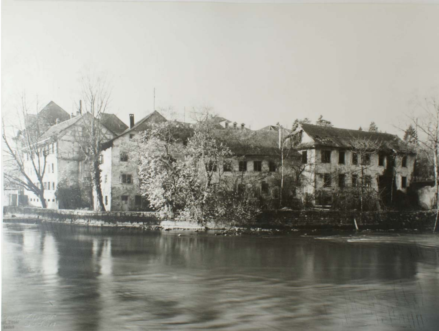
Die nördlichen Bauten des „Staadhof“ während deren Abbruch in den 1920er-Jahren. An Stelle der damals geschleiften Gebäude befindet sich heute der kleine Park im Limmatknie.

Dem „Hinterhof“ stand der „Hof nid dem Rein“ bzw. der seit dem 15. Jahrhundert nach seinem damaligen Besitzer Conrad am Staad genannte „Staadhof“ an Komfort und Bedeutung kaum nach. Auch hier logierten bedeutende Gäste.